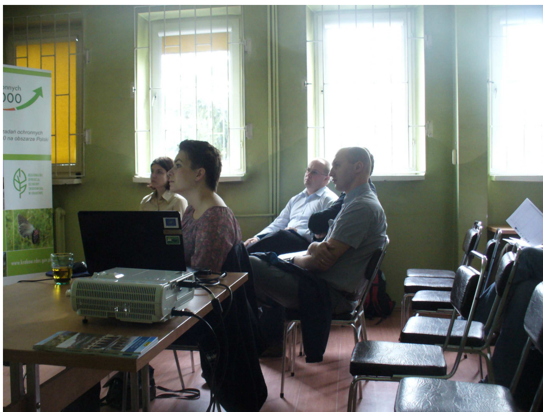
III warsztaty konsultacyjne – Dolina Dolnej Soły