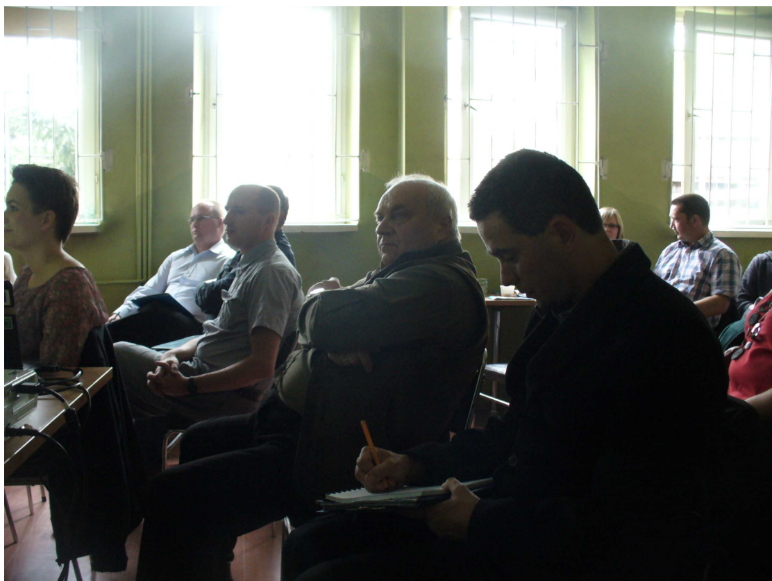
III warsztaty konsultacyjne – Dolina Dolnej Soły