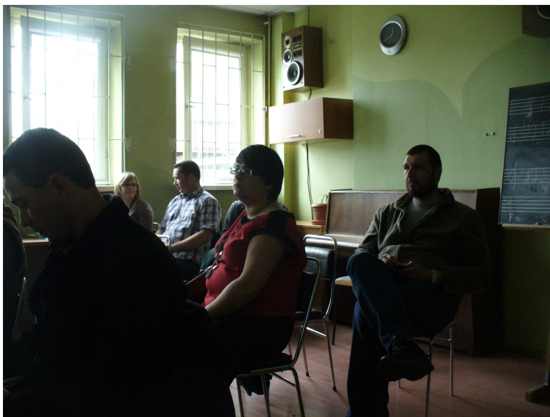
III warsztaty konsultacyjne – Dolina Dolnej Soły