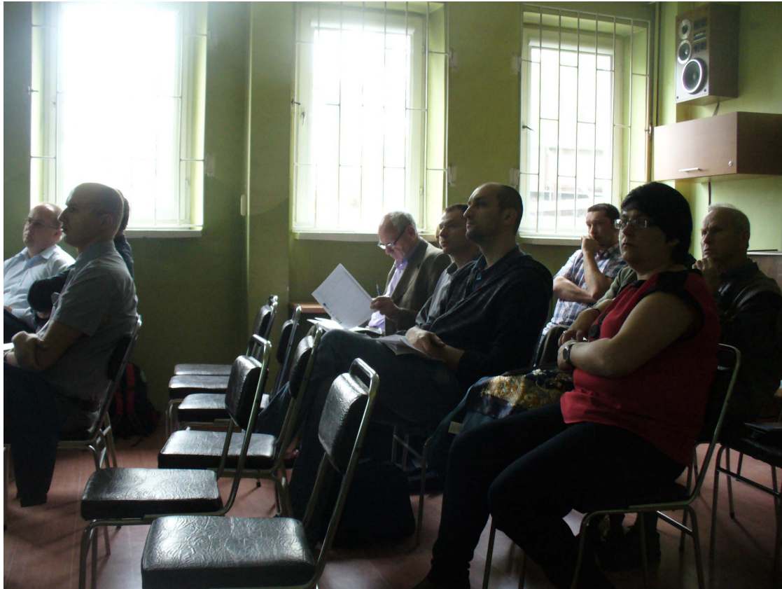
III warsztaty konsultacyjne – Dolina Dolnej Soły